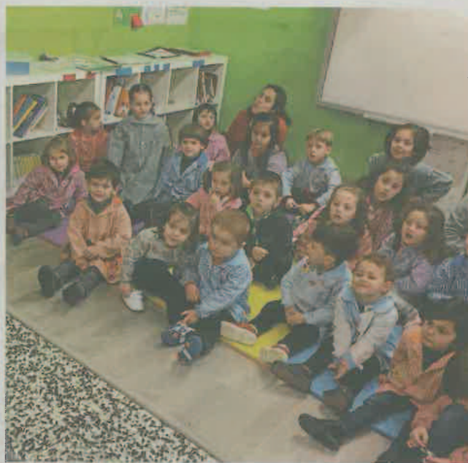
Alumnos del CPI de Zas durante la sesión de Diverescola con Íntegro.

Desde Íntegro aseguran que fue una experiencia muy positiva y enriquecedora, y que la Diverescola refuerza la apuesta del colectivo por fomentar una