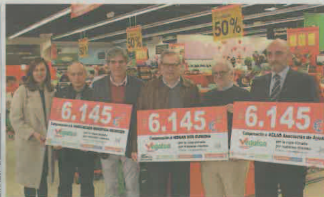
La Asociación Contra la Droga de A Coruña recibe un cheque por importe de 6.145 €.

tendencias@elcorreogallego.es elcorreogallego.es