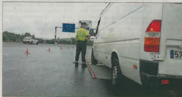
Un agente durante un control.

dad supera los 20 años y cerca del 70% tienen ya una década. Según el último estudio realizado por Tráfico, el riesgo de fallecer o sufrir una lesión con hospitalización aumenta con la antigüedad del vehículo. En comparación con los turismos de hasta cuatro años, el riesgo de fallecimiento es 1,6 veces superior en los coches de 10 a 14 años y más del doble en los que tienen de 15 a 19 años. Teniendo en cuenta esta relación entre riesgo y antigüedad del vehículo, el mantenimiento adecuado de