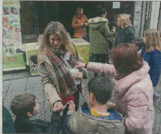
Campaña de la Federación Galega de Enfermedades Raras en Pontevedra.

"La limitación en la obtención de datos clínicos fiables y exhaustivos reside, sobre todo, en la dispersión geográfica de los casos, en la dificultad de establecer un diagnóstico definitivo y en la complejidad de la integración de los múltiples subsistemas", argumenta Sanidade en el borrador del decreto para crear el Registro. Este fichero,